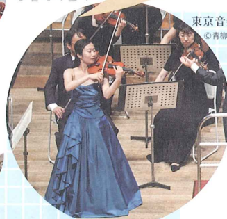
東京音楽コンクール