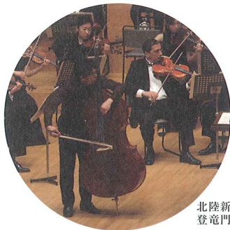
北陸新人 登竜門コンサート